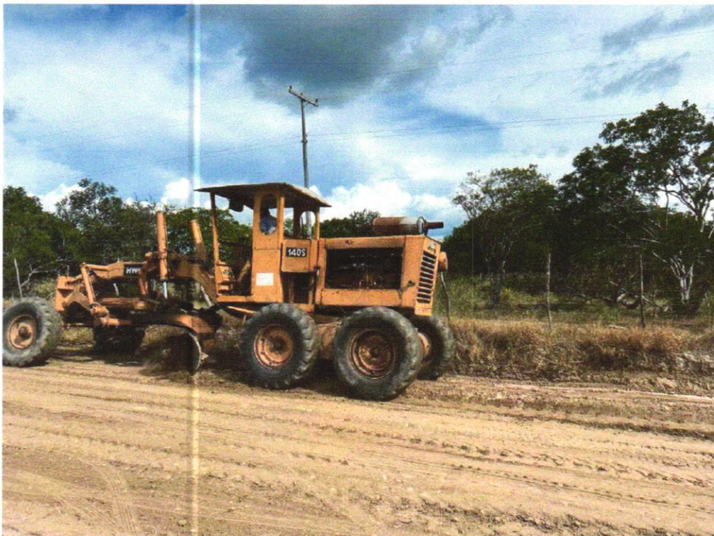
Foto 08- ESPALHAMENTO DE MATERIAL COM TRATOR DE ESTEIRAS. AF_11/2019

Wendel Simões Cruz 13 749.778/0001-0 W.S. ENGENHARIA LTDA. RUA Inácio Ribeiro, 808 - Goiás CEP: 74.110-000 - Goiânia - GO