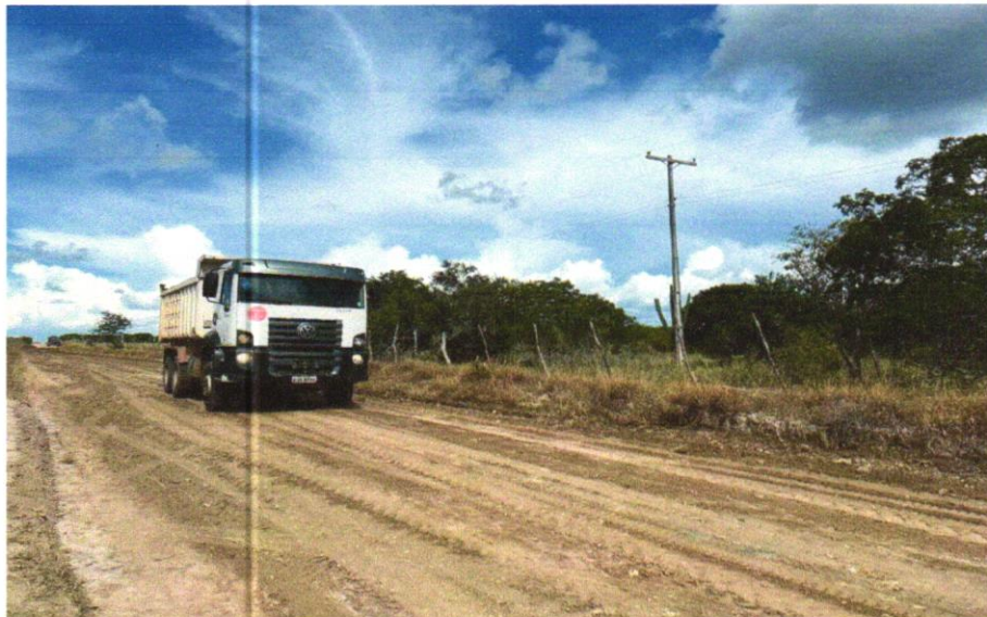
FOTO 04 - TRANSPORTE COM CAMINHÃO BASCULANTE DE 6 M 3 , EM VIA URBANA EM LEITO NATURAL (UNIDADE: M3XKM). AF_07/2020

Wendel Simões Cruz 13 749.775/0001-0 ENR - ENGENHARIA LTDA Rua Aristóteles Ribeiro, 806 - Galvão Cidade de Ilhéus - Bahia