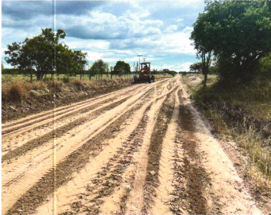
FOTO 03 - ESCAVACAO E CARGA MATERIAL 1A CATEGORIA, UTILIZANDO TRATOR DE ESTEIRAS DE 110 A 160HP COM LAMINA, PESO OPERACIONAL * 13T E PA CARREGADEIRA COM 170 HP

EMPREENDIMENTO Recuperação de Estradas Vicinais