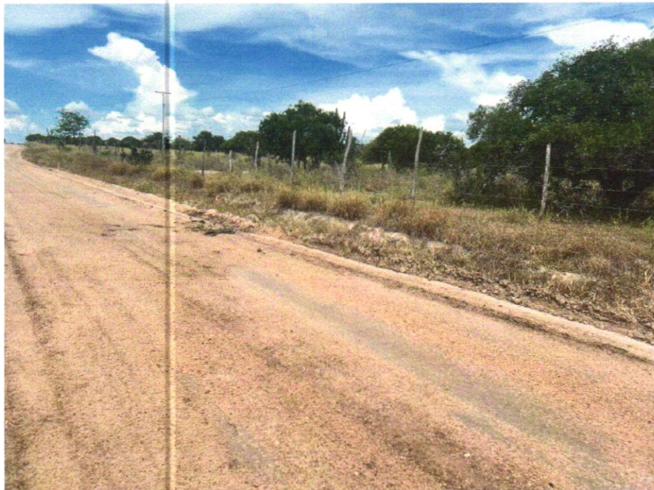
Foto 06- EXECUÇÃO E COMPACTAÇÃO DE ATERRO COM SOLO PREDOMINANTEMENTE ARGILOSO - EXCLUSIVE SOLO, ESCAVAÇÃO, CARGA E TRANSPORTE. AF_11/2019

Wendel Simões Cruz 13 749.776/0001- WRY ENGENHARIA LTDA RUA Francisco Ribeiro, 806 - Graças 1 CEP 41.100-000 - Salvador - Bahia