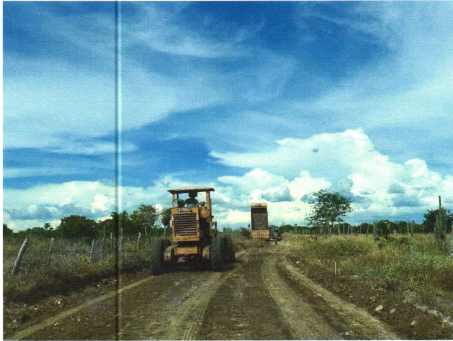
Foto 05- ESPALHAMENTO DE MATERIAL COM TRATOR DE ESTEIRAS. AF_11/2019

EMPREENDIMENTO Recuperação de Estradas Vicinais