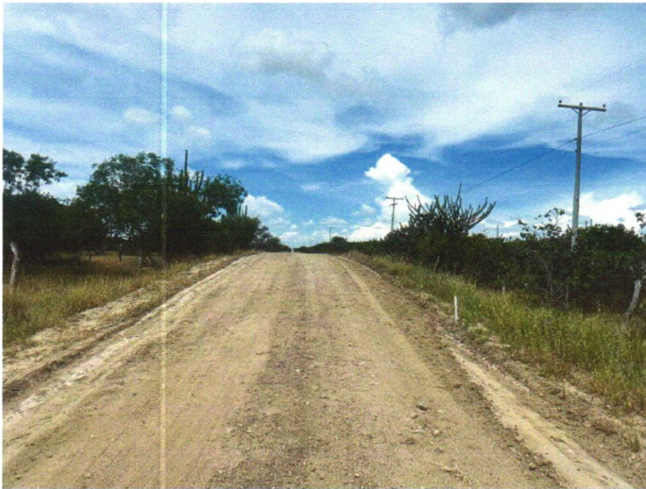
FOTO 01 – REGULARIZAÇÃO DE SUPERFÍCIES COM MOTONIVELADORA. AF_11/2019

EMPREENDIMENTO Recuperação de Estradas Vicinais