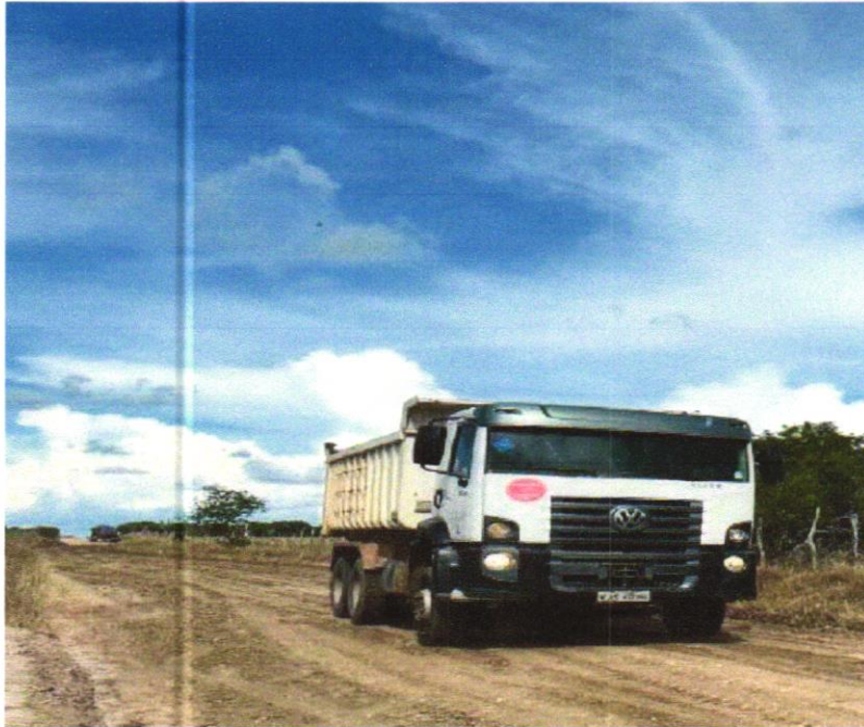
Foto 07 - TRANSPORTE COM CAMINHÃO BASCULANTE DE 10 M 3 , EM VIA URBANA EM LEITO NATURAL (UNIDADE: M3XKM). AF_07/2020

EMPREENDIMENTO Recuperação de Estradas Vicinais