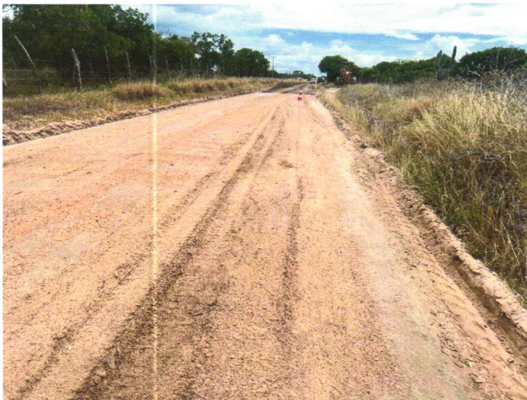
Foto 09 - EXECUÇÃO E COMPACTAÇÃO DE ATERRO COM SOLO PREDOMINANTEMENTE ARGILOSO - EXCLUSIVE SOLO, ESCAVAÇÃO, CARGA E TRANSPORTE. AF_11/2019

EMPREENDIMENTO Recuperação de Estradas Vicinais